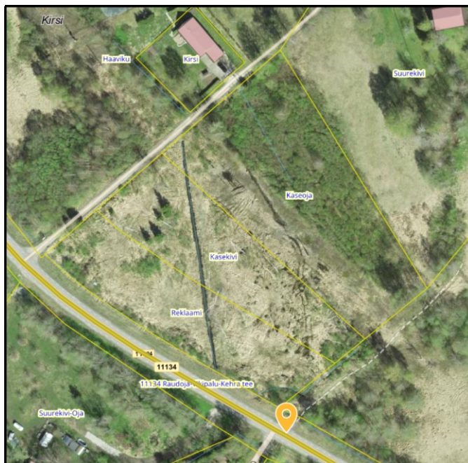
Joonis 1. Riigitee nr 11134 km 9,731 ristumiskoha asukoht